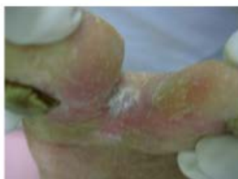
足指の間に できた水虫